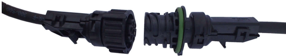
Bilde 1. Strømkabelens plugg

Ved bruk av feiekost skal du sørge for at børstene brukes samsvar med kravene fastsatt av produsenten (bilde 2).