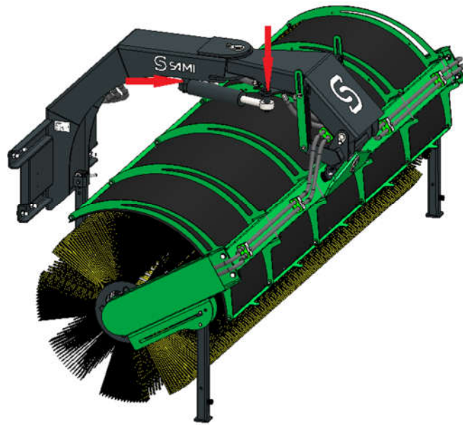
Bilde 3. Smørenipler

Hvis du ikke har planer om å bruke enheten i en lengre periode, gjør følgende: