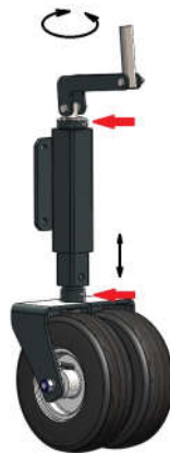
Tegning 3. Støttehjul justering og plassering av smørenipler