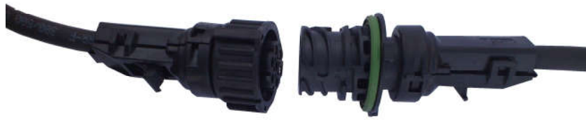
Tegning 2. Elektrisk kabel kontakt