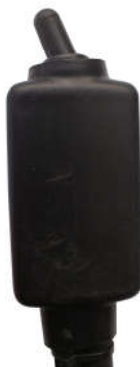
Tegning 1 Plogens arbeidsoperasjons bryter

Bevegelsen av plogens vinger framover eller bakover skjer samtidig. Støttehjulenes arbeidshøyde er justerbar. Finn passende arbeidshøyde i forhold til snø- og værtype.